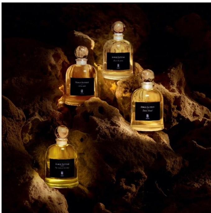
Flacons de Table 吊钟瓶系列