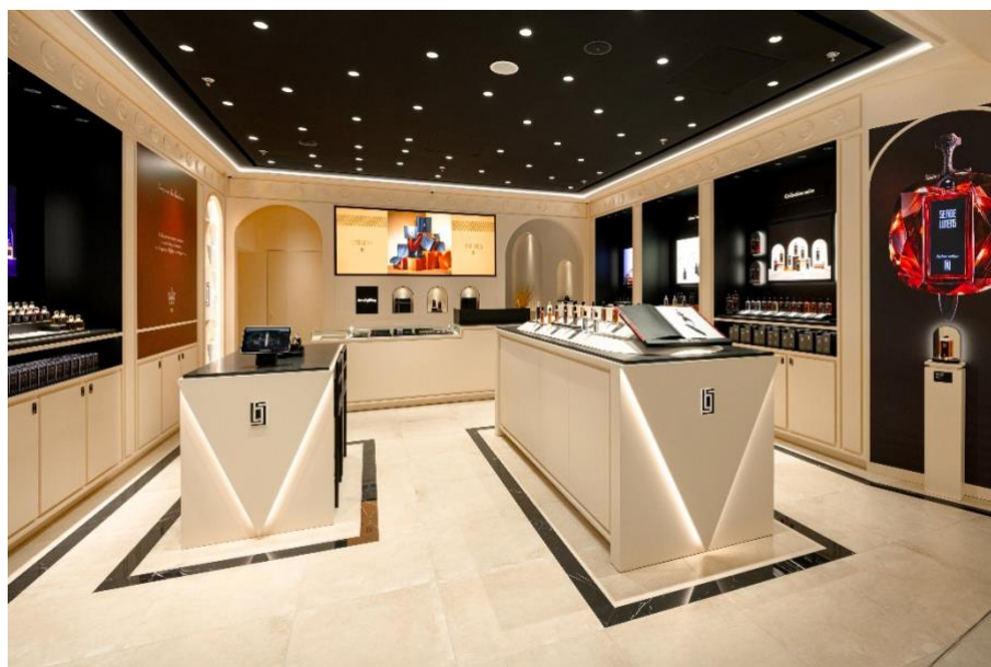
Serge Lutens 芦丹氏正式进入中国大陆市场