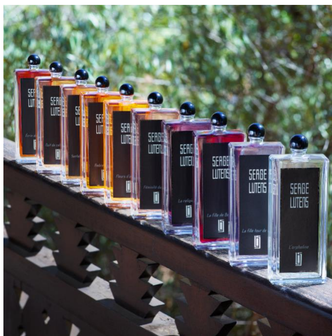
Collection Noire 黑色礼服系列

2026 年 1 月 10 日起，Serge Lutens 芦丹氏艺术沙龙已正式对公众开放。消费者可以在新店体验品牌各系列经典 —— 包括神秘迷人的「Collection Noire 黑色礼服系列」、标志性艺术典藏「Flacons de Table 吊钟瓶系列」、纯净舒缓的「Matin Lutens 晨曦系列」营造空间嗅觉旅程的「At Home 梦寐心居系列」以及「Nécessaire de Beauté 彩妆系列」。顾客可在此沉浸体验，感受每一缕气息的层次与故事，门店亦有专业的品香顾问提供细致深入的讲解，引领贵宾步入专属感官艺境，定制专属于你的故事。