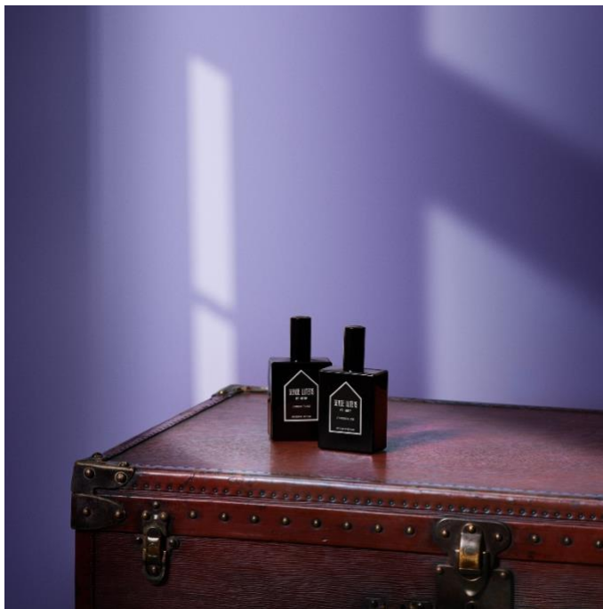
At Home 梦寐心居系列