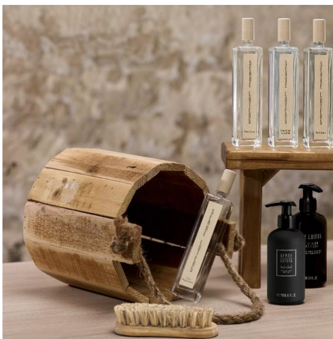
Matin Lutens 晨曦系列