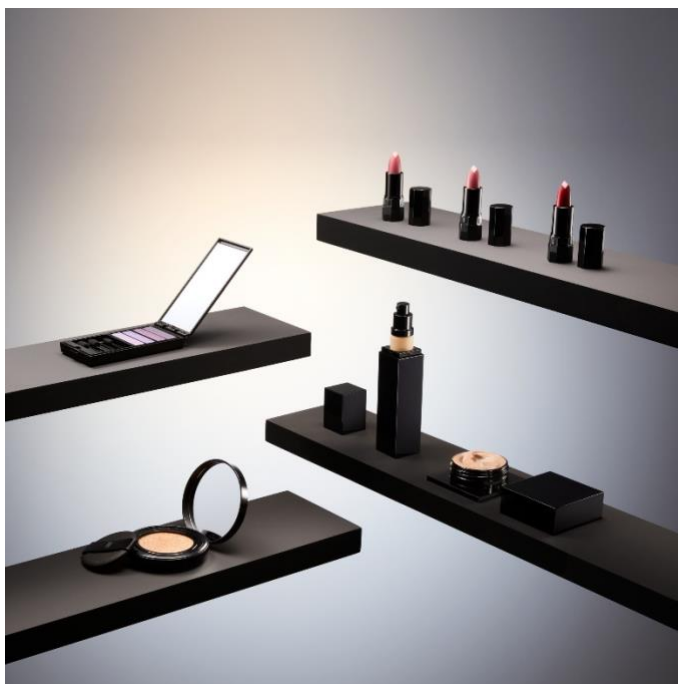
Nécessaire de Beauté 彩妆系列