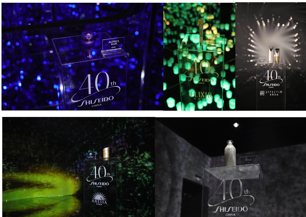
资生堂集团旗下人气品牌携明星单品进驻主题空间