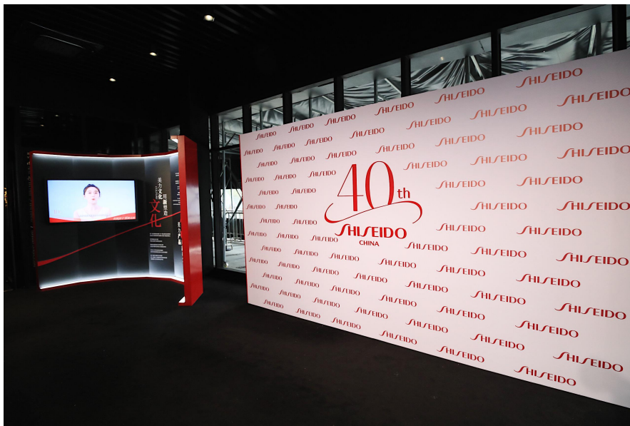
资生堂中国 40 周年创美展

2021 是资生堂集团进入中国的第 40 个年头。这是日新月异、不断开拓的 40 年，也是不忘初心、以美赋能的 40 年。3 月 9 日，资生堂中国在上海 teamLab 无界美术馆特别举办 40 周年创美展及晚宴，上海市人民政府副市长宗明、浦东新区人民政府副区长杨朝、资生堂中国区总裁藤原宪太郎先生亲临现场，一同回溯四十载“美力”时光。