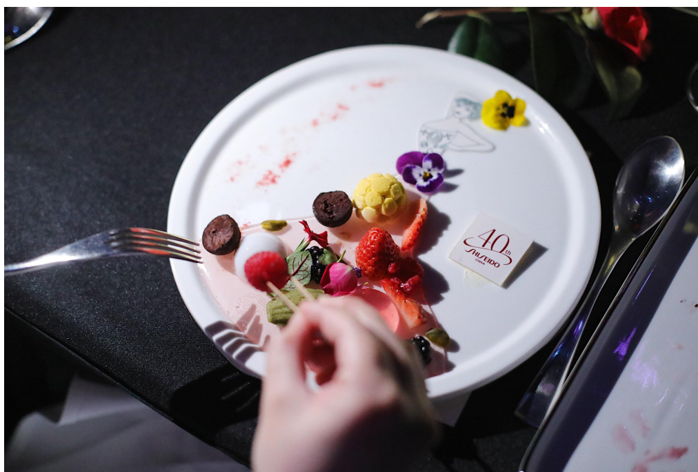
代表产品“美力”的DIY甜品创意源自 “日本商业美术之夫”山名文夫时任资生堂创意总监期间的代表作之一

一直以来，资生堂致力于将日式美学与东方美韵创新交融，晚宴也精选了 4 道寓意别致的佳肴，配合 4 支由资生堂集团旗下品牌代言人章子怡、黄轩等明星配音的影片，将资生堂中国为环境、社会、文化和产品赋能的“美力”历程逐一呈现。