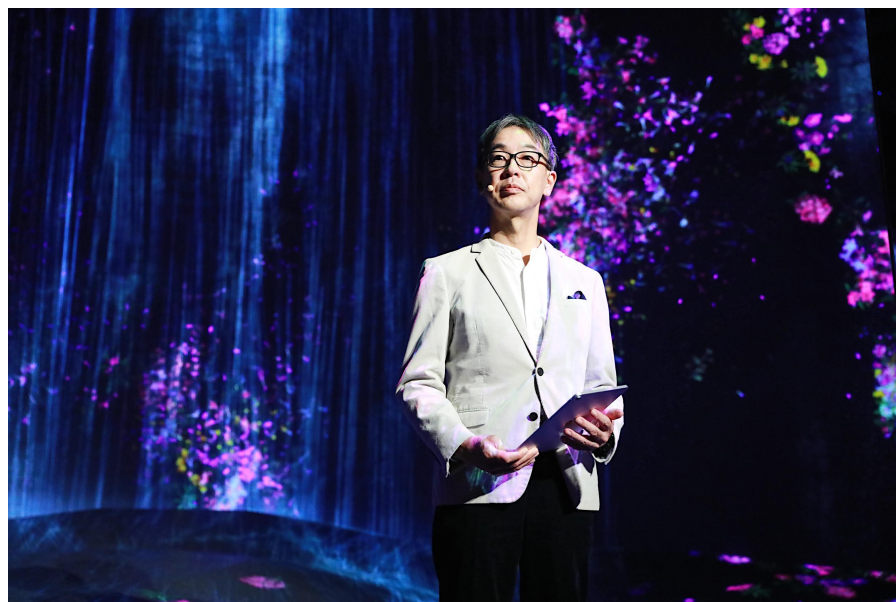
资生堂中国区总裁藤原宪太郎先生上台致辞

式，获得了事业的飞跃式发展。中国消费者能带着“美力”积极自信地前行，这些也成为了资生堂“创美无限”的原动力。今后资生堂中国也将秉持“美力创新让世界更好”的企业使命，创造出更好的产品与服务，以满足中国消费者的期望。