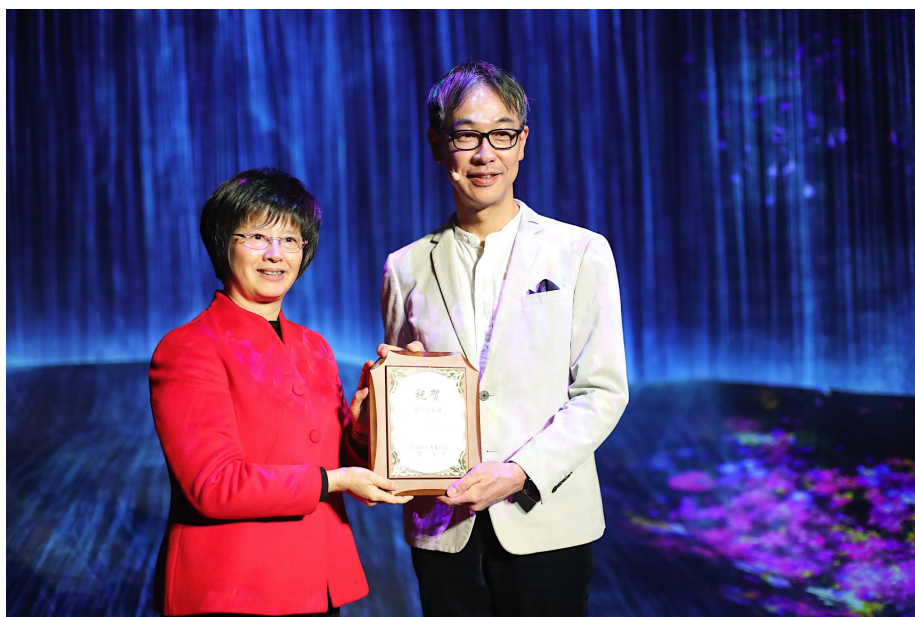
上海市人民政府副市长宗明为资生堂颁发在华发展 40 周年铭牌

资生堂于改革开放之初就进驻中国，在时代浪潮中激流勇进精神的嘉奖。相信在上海政府的坚定支持下，资生堂可以持续进取，如鱼谷社长所言“让每一位中国消费者都实现一生健康与美”。