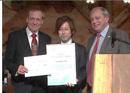
第30届大会(2018年)获奖情形