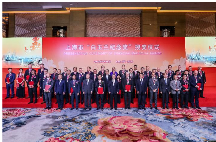
“白玉兰纪念奖”授奖仪式

“白玉兰纪念奖”是上海市设立的对外表彰奖项，每年颁授一次，旨在鼓励和表彰对上海市经济建设、社会发展和对外交流等方面做出突出贡献的外籍人士。截至目前，已有1266位外籍人士获得“白玉兰纪念奖”。