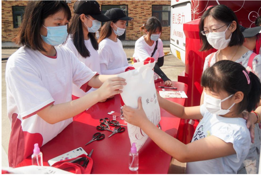
7月25日爱心亲子日活动，战疫医护家庭体验美甲服务，并领取爱心游园大礼包

在欢乐之余，资生堂也见证了许多感人的瞬间。战疫援助归来，爱心亲子日是不少医护家庭的第一次出游。虽然平时父母的陪伴少之又少，但面对镜头，孩子们还是自豪地说出：“我的妈妈是超人！”纯真的童言童语，传递的是一份深深的爱与依赖。